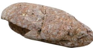
仁淀川にやってきました「にょちゃん」

Let's change a rock into a precious treasure by the magic of words! Give the rocks a name that is perfect for it!