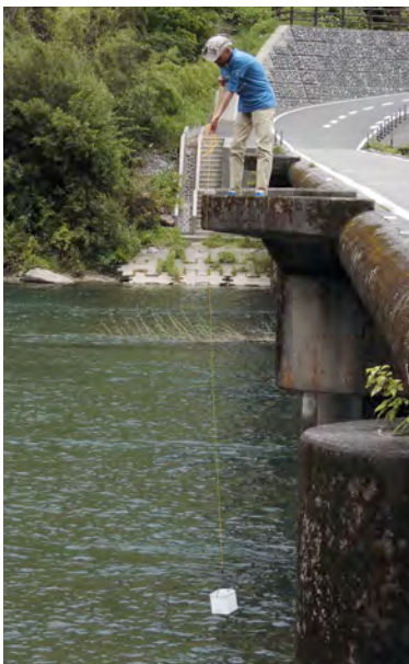
身近な水環境の全国一斉調査

Think global, Act local 川は流域の人の心を映す鏡である。 人の心、意識を変えなければ川は変わらない。 川 が変われば海も変わる。 海が変われば地球全体が変わるのである。